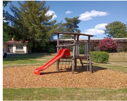
Instandhaltung aller Spielplätze

Gemeinsam tragen wir dazu bei, unsere Gemeinde lebenswert und attraktiv zu gestalten. Bei Fragen stehen wir Ihnen gern zur Verfügung.