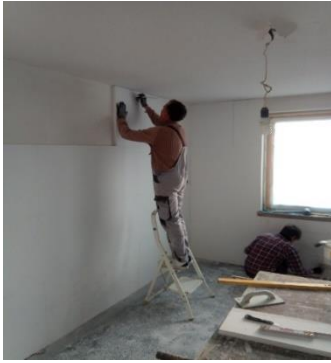
Wohnungssanierung Lehnberweg im OT Schmölln