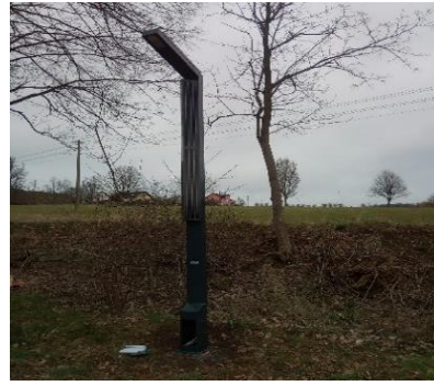
Errichtung Solarlaterne im OT Schmölln