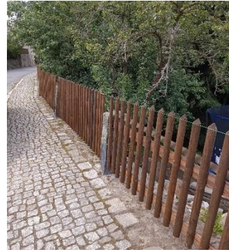
Zaunbau „Am Schwarzwasser“