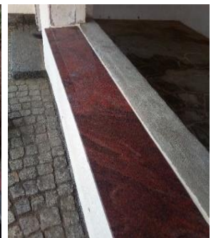
Herstellung Fundamente für Bänke / Vorbereitung neuer Bankklatten für alle Ortsteile