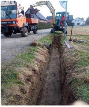
Trockenlegung Uferweg im OT Putzkau