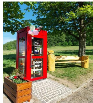
Vorarbeiten für die Errichtung einer „Bücherzelle“ im OT Tröbigau

Engagierte „Träbcher“ haben sich in Tröbigau in Eigeninitiative einen Anlaufpunkt im Ort erschaffen. Ansässige Selbstständige aus Tröbigau und Neuschmölln, Dorfbewohner und Mitstreiter unterstützen dabei die „Träbcher Minibücherei“.