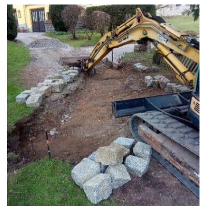
Straßenentwässerung Steinweg/Mühlenstraße im OT Putzkau