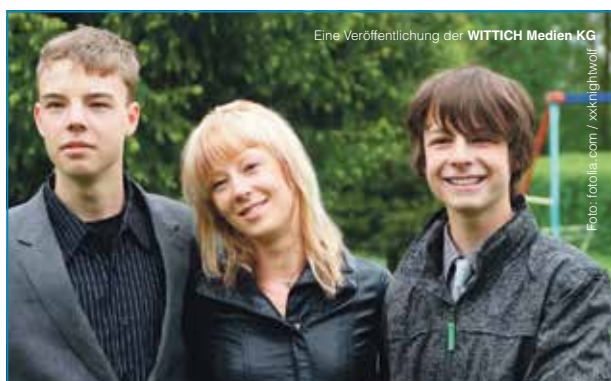
Eine Veröffentlichung der WITTICH Medien KG

LINUS WITTICH Medien KG, An den Steinenden 10, 04916 Herzberg, vertreten durch Geschäftsführer ppa. Andreas Barschtipan, www.wittich.de/agb/herzberg Mit dem Einreichen eines Artikels/Bildes erklärt der Einreicher, dass keine Rechte Dritter bestehen bzw. durch die Veröffentlichung Rechte Dritter nicht verletzt werden bzw. das Einverständnis der abgebildeten Person zur Veröffentlichung (im Tageblatt sowie online) erteilt wurde. Erscheint monatlich kostenlos an alle Haushaltungen im Verbreitungsgebiet – zusätzliche Einzel Exemplare sind über die Stadtverwaltung zu beziehen.