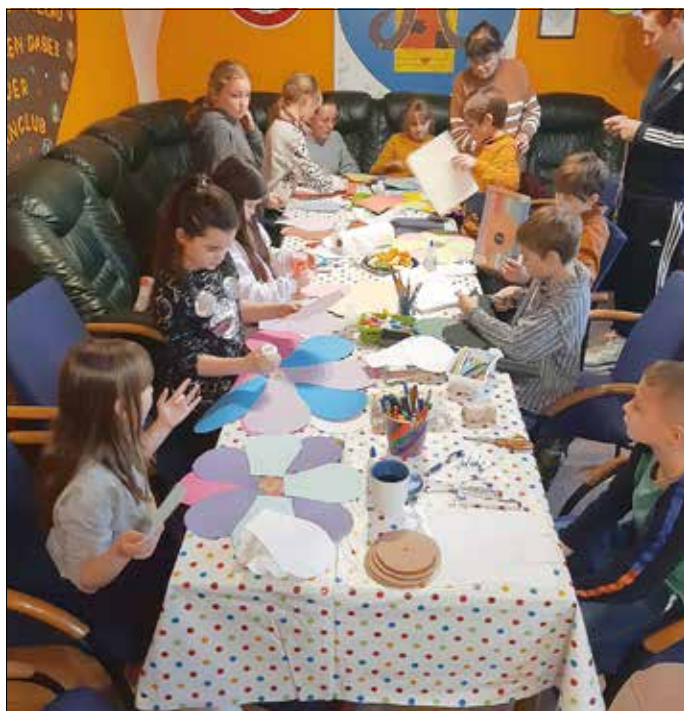
Kreativnachmittag - Lampen