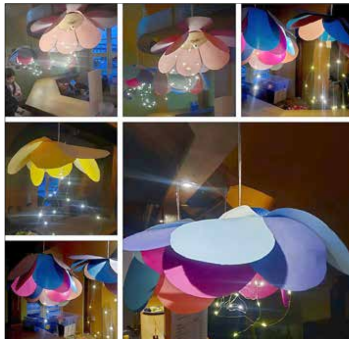
Kreativnachmittag - Lampen