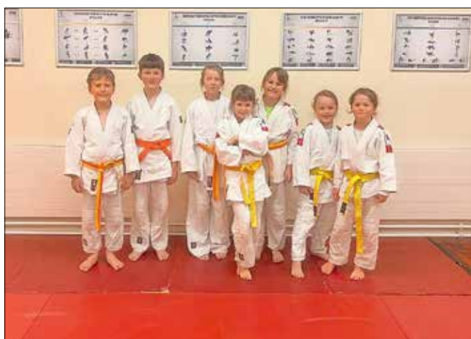
nach dem gemeinsamen Training