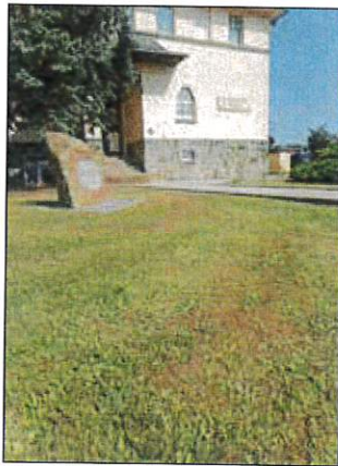
Gepflegte Rasenflächen an der Schule