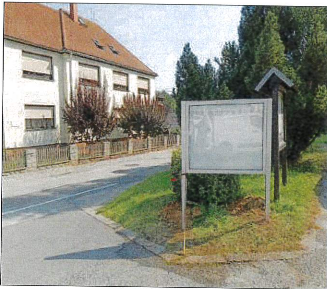
Schaukasten Dorfstraße Arztpraxis