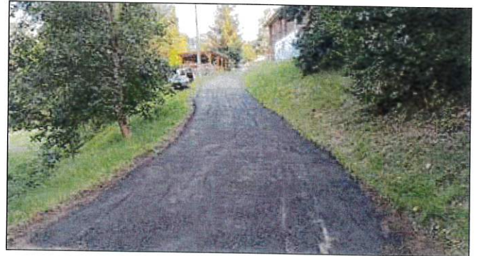
Straße Am Mühlteich