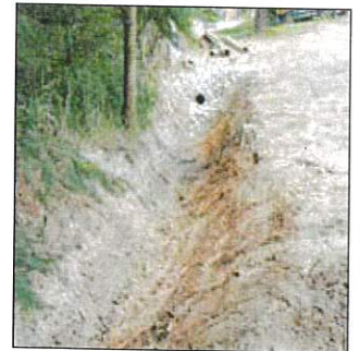
Bau Straßenentwässerung Ziegelbergsiedlung