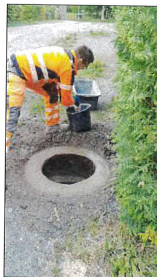
Reparatur und Erneuerung von Schächten