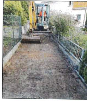
Schotterrasen in den Neuen Häusern