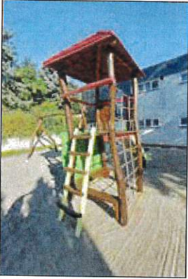
Neuer Farbanstrich am Spiegelgerät Schule

Der Hausmeister arbeitet 2 Tage in der Woche in der Dr.-Alwin-Schade-Schule. Neben Reparatur- und Instandhaltungsmaßnahmen nahm im 3. Quartal die meiste Zeit der Arbeit für die Pflege der Außenanlage in Anspruch. Dazu zählen u.a. die Grasmahd, Schulhof reinigen, Rabattenpflege, Blumenbepflanzungen sowie Heckenschnitt. Ebenso gehört der Fußballplatz, die Pflege der Leichtathletikbahn und die dazugehörige Sprunggrube zu den regelmäßigen Tätigkeiten. Durch die tolle Unterstützung der Kollegen aus dem Bauhof war es möglich, die kinderfreundliche Farbgestaltung des Spielplatzes sowie des Schulhofes umzusetzen und den Schulleitung sowie das Sportfest vorzubereiten.