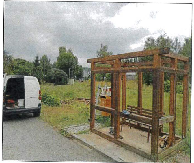
Abriss des alten Buswartehäuschens am Bahnhof Schmölln