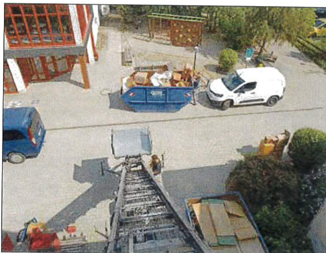
Ausräumen der Schule