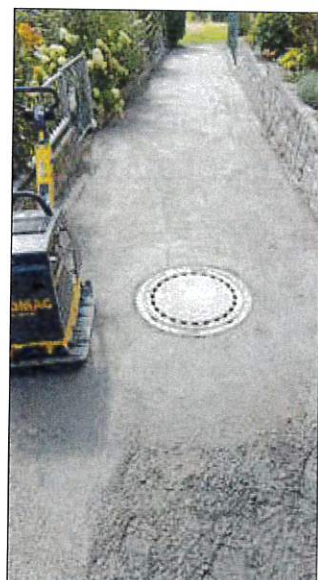
Schotterrasen in den Neuen Häusern

Ihr Bauhof Team Straßenreparaturarbeiten