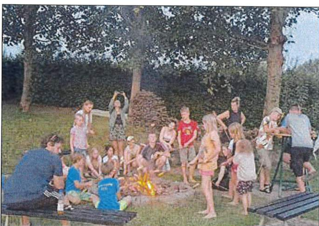
Ein toller Abend - Es hat Spaß gemacht!