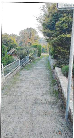
Geh- u. Radweg in den Neuen Häusern

Grundschule für den bevorstehenden Umzug in die Containeranlage an der Brauereistraße. Ebenso wurden drei neue Schaukästen an der Bushaltestelle Bischofswerdaer Straße, Parkplatz Dr. Knoll in Schmölln und in Tröbigau an der Kegelhalle errichtet und es erfolgte der Abriss der Bushaltestelle am Bahnhof in Schmölln. Der Bauhof unterstützte auch die Vereine wie zum Beispiel beim Badfest, Kegelfest, Dorffest, Oktoberfest und den SV Schmölln/O.L e.V bei der Rasenpflege.