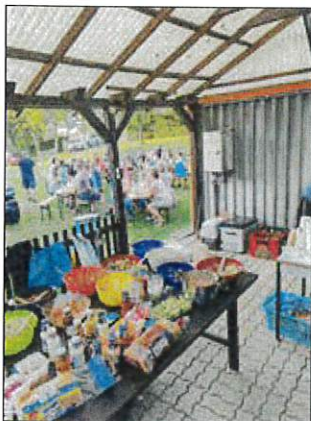
Die Verpflegung war jederzeit gesichert