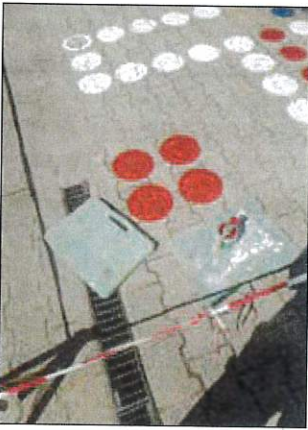
Spielfläche auf dem Schulhof