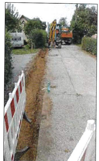
Errichtung von Borden in den Neuen Häusern