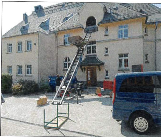
Ausräumen der Schule