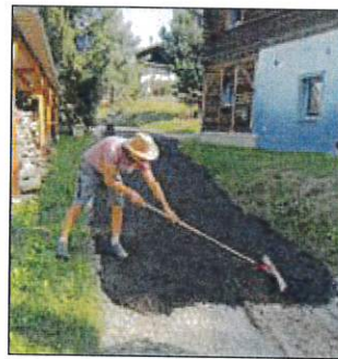
Straßenbau Am Mühlteich