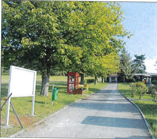
SChaukasten Kegelhalle Tröbigau