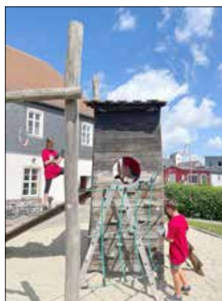
Anstrich Spielgeräte