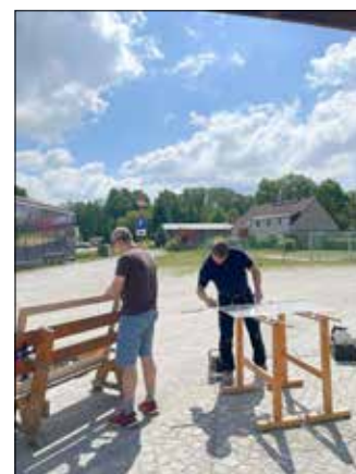
Renovierung Schautafel Herrenhaus